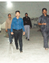
अंतर्गत ग्राम पोता का हनुमान जी राइस मिल का औचक निरीक्षण किया गया। निरीक्षण के दौरान रिकार्ड के अनुसार जहां लगभग 12,900 क्विंटल धान एवं चावल का भंडारण

समर्थन मूल्य पर चल रही धान खरीदी के अंतिम दिनों में अफसरों की टीम लगातार दबिशा दे रही है। इसी कड़ी में सक्ती जिले के पोता में राइस मिल की जांच की गई, जहां रिकार्ड के अनुसार धान व चावल नहीं होने पर मिल को सील किया गया। धान खरीदी नोडल अधिकारी एवं जिला विभाग के अनुसार धान व चावल नहीं होने पर मिल को सील किया गया। धान खरीदी नोडल अधिकारी एवं जिला विभाग के अनुसार धान व चावल नहीं होने पर मिल को सील किया गया।