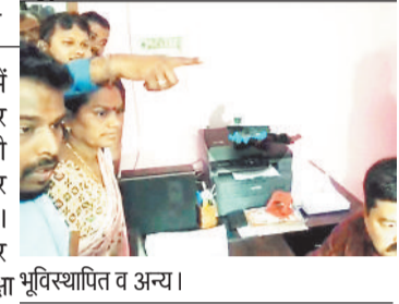
कोयला उत्खनन और ओवरबर्डन का काम कर रही पीएनसी कंपनी कार्यालय का जोरदार घेराव किया।

एसईसीएल गेवरा माइंस में कोयला उत्खनन और ओवरबर्डन का काम कर रही पीएनसी कंपनी कार्यालय का जोरदार घेराव किया। प्रदर्शनकारियों ने कंपनी पर भर्ती के नाम पर 50 हजार से 1 लाख रुपये तक की अवैध वसूली के आरोप लगाए हैं।