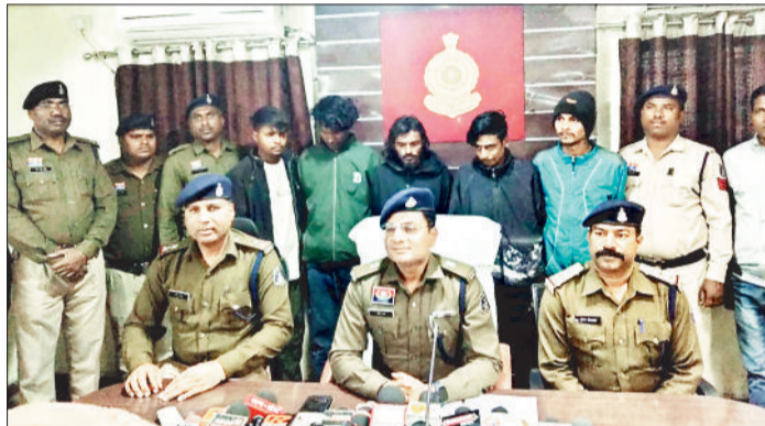
मामले का खुलासा करती पुलिस के अधिकारी।