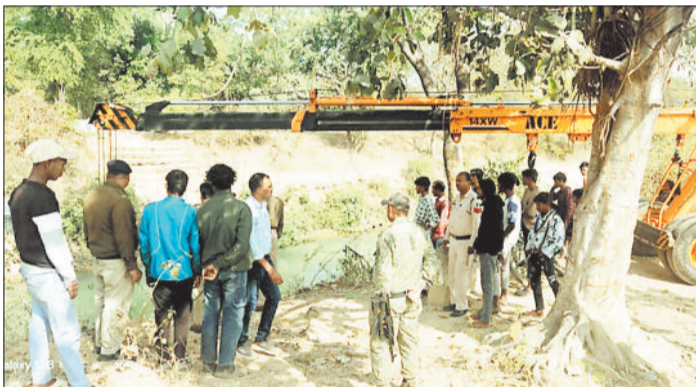
नहर में डूबी पुल के लोहे को क्रैन से निकालते