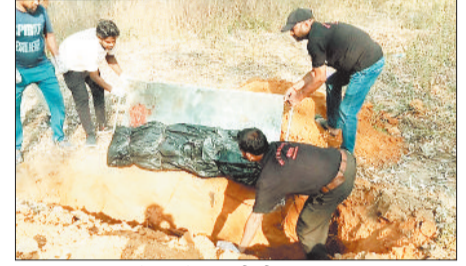
कफन दफन करते एसजेआर की टीम।